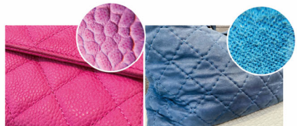
反絨皮(水洗魚子醬) 翻毛皮(反毛皮)